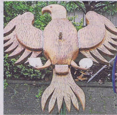
Wer diesen Vogel erlegt, wird neuer Schützenkönig.